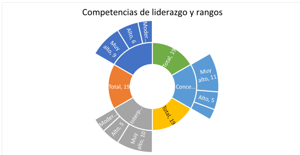
Figura 2. Competencias de liderazgo y rango

Nota: La figura detalla los tipos de competencias analizadas con sus respectivos porcentajes de acuerdo a cada ítem o pregunta del cuestionario con su respectiva puntuación y rango.